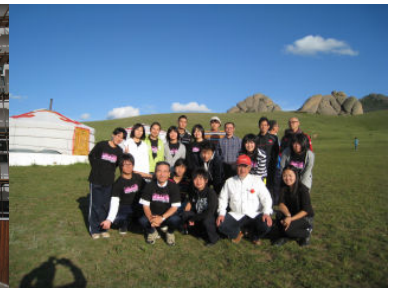
テレルジ国立公園