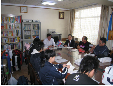
新モンゴル高校の説明

9:00 学校集合 →9:30 新モンゴル高校の見学→10:00 高校生との交流会 →12:00 昼食(新モンゴル高校食堂) →13:00 点灯式準備→14:30 太陽光発電システム点灯式→ 16:30 テレルジ国立公園へ自然体験研修発 → 18:00 テレルジ国立公園着 → 19:00 夕食 →ゲル体験宿泊