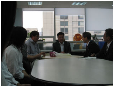
ウランバートル市教育局訪問

8:00 テレルジ国立公園発 → (バス) →10:30 ウランバートル市教育局訪問→モンゴル国会議事堂広場見学→11:30 JICAモンゴル事務所訪問→13:30 昼食(市内レストラン) →15:00 市内研修→19:00 新モンゴル高校PTA会主催・夕食会→21:00 ホテル着