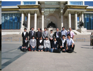
モンゴル国会議事堂前