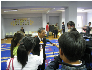
現地テレビ局の取材