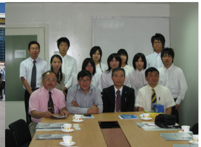
JICAモンゴル事務所訪問