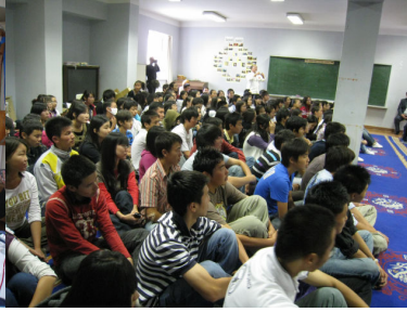
新モンゴル高校生との交流会