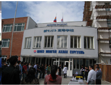
太陽光発電システム点灯式